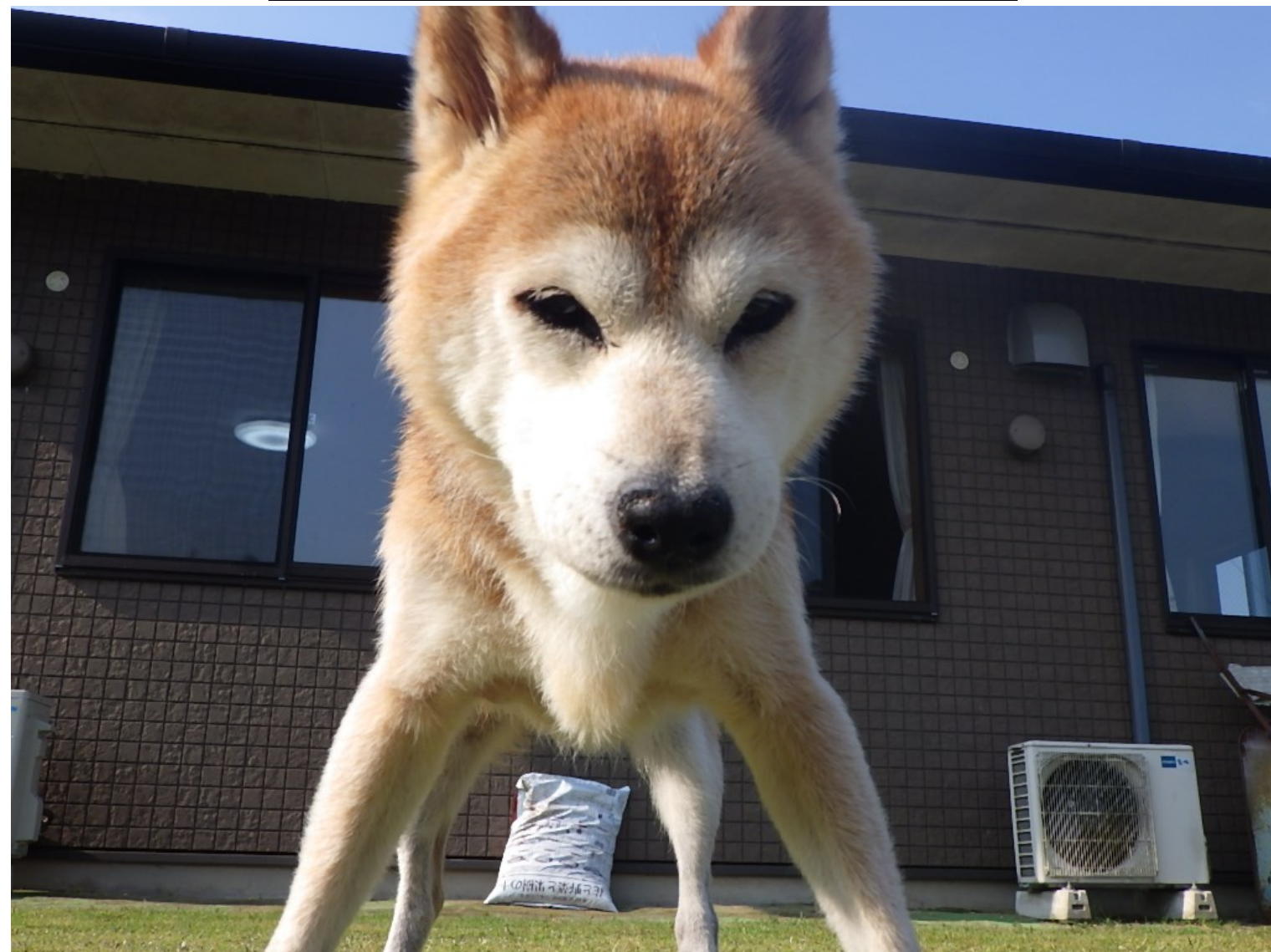
千代ちゃんはお外でお散歩♪たまの天気の日にはパシャリ♪カメラ目線も決まっています(〇´▽´)〇